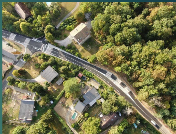
Route du Revard (juillet 2023)