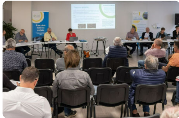
Comité Syndical du 11 juin, à Albertville