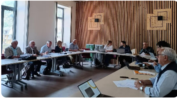
Bureau Syndical du 11 septembre, à Modane