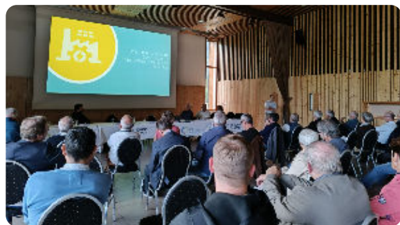
Comité Syndical du 24 septembre, à Argentine

En 2024, le SDES a décidé de délocaliser ses instances à Albertville en juin et à Modane et Argentine en septembre pour permettre aux différents élus de Savoie de participer aux réunions.