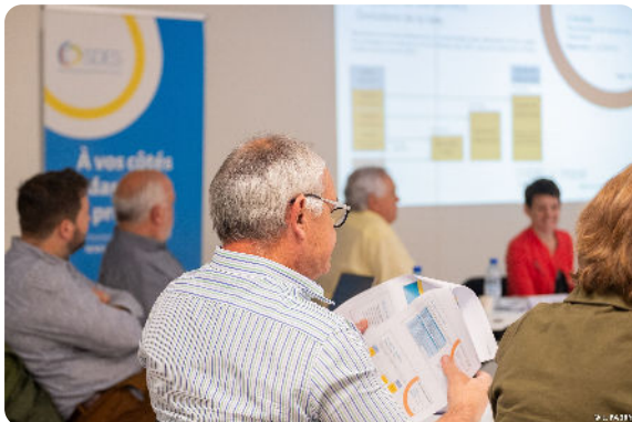
Comité Syndical du 11 juin, à Albertville